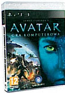
AVATAR: GRA KOMPUTEROWA (PC, PS3, X360) Ubisoft