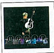
DAVID BOWIE A Reality Tour Sony Music