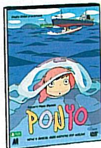
PONYO reż. Hayao Miyazaki Japonia 2008 Monolith Video