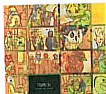
PAWILON Moda na sukces Blodro Records