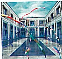
EFTERKLANG Magic Chairs 4AD/Sonic